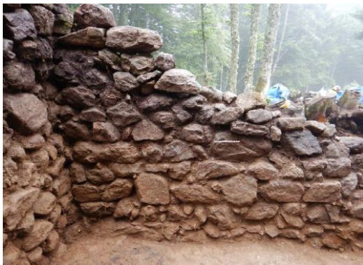
Élévation sud de B2 avec niveau de sol (Xe-XIe s.).