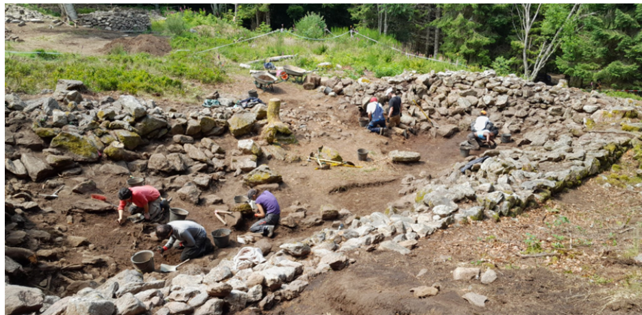
Bâtiment oriental en cours de dégagement.