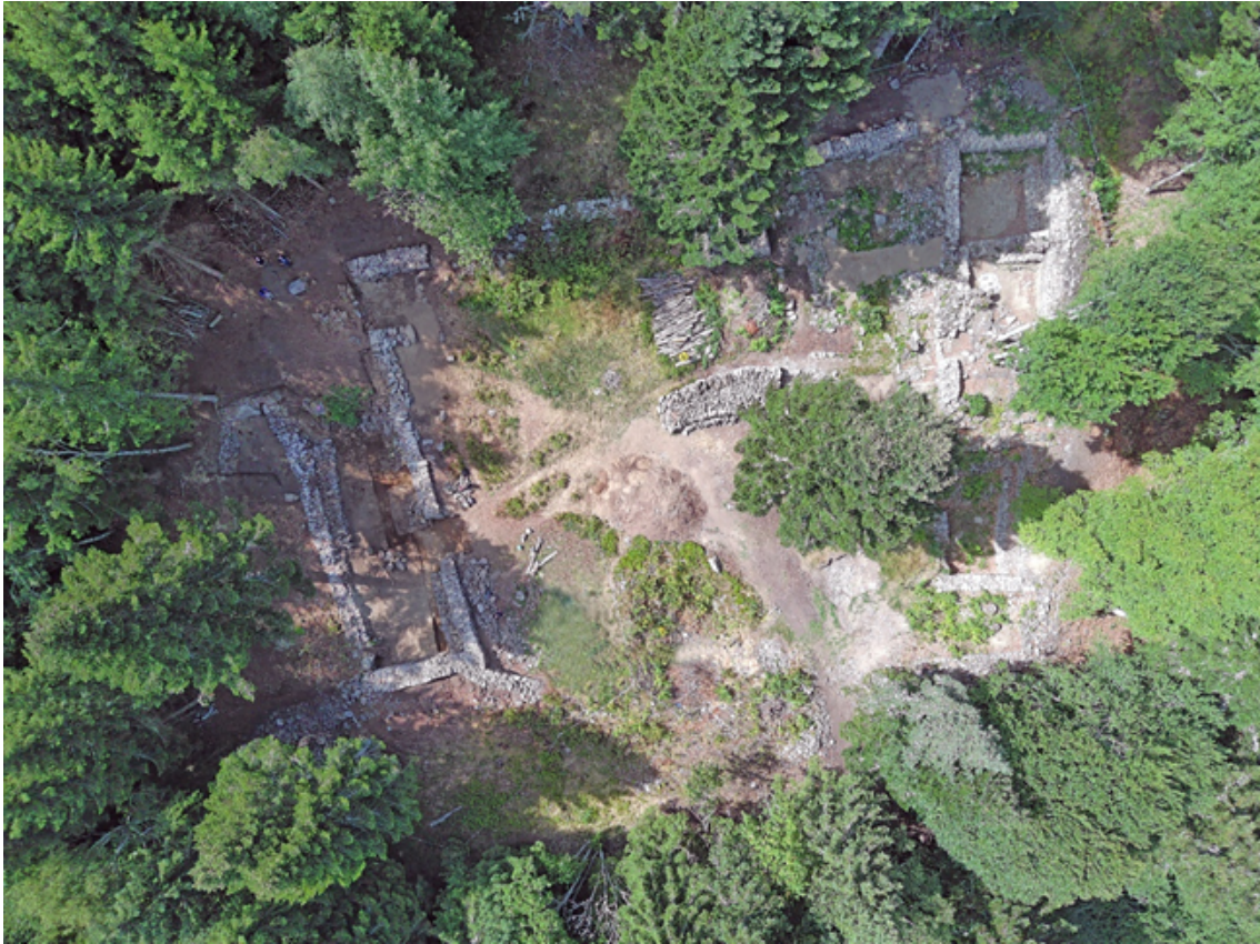
Vue zénithale du site en cours de fouilles.