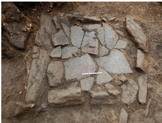
Foyer aménagé Fo B2.356 (14 C : 1046-1084 ap. JC).

La campagne 2023 viendra clore l'opération triennale avec la fouille de l'aire centrale, d'un bâtiment barlong et du système de clôture du site mais également la mise en évidence d'une probable structure hydraulique.